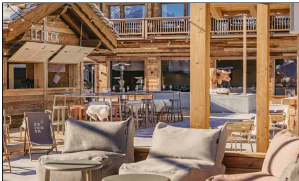
La décoration sublime les matériaux nobles: le vieux bois et la pierre.

mettent aux hôtes, suivant les envies et les moments, de s'isoler un peu ou au contraire de se joindre aux autres résidents. C'est